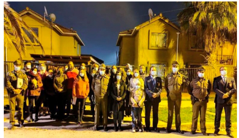
Foto 9. Sector, las Perdices, colindante Cerro Chequén, Ponte Alto, Marcha exploratoria de Seguridad 2021.