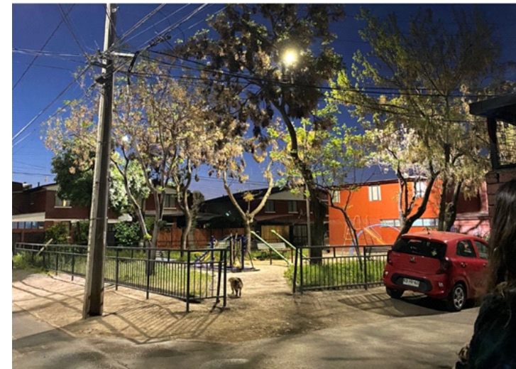
Foto 3. Villa Andes del Sur, luminaria obstruida por vegetación crecida en contexto de pandemia COVID destacada por vecinas en Marcha Exploratoria diagnóstica.

En la metodología CPTED es muy relevante no sólo buscar estrategias para la reducción delictiva, sino que también de percepción de inseguridad. Diversas experiencias en la comuna de Puente Alto involucrando a comunidades en diagnósticos participativos especialmente con la Nube de Sueños donde dibujan los cambios soñados en su entorno han mostrado que una de sus principales necesidades ambientales y a veces incluso urgencia ambiental es mejorar el parque de alumbrado público tanto en zonas de transporte, residenciales y comerciales de la comuna.