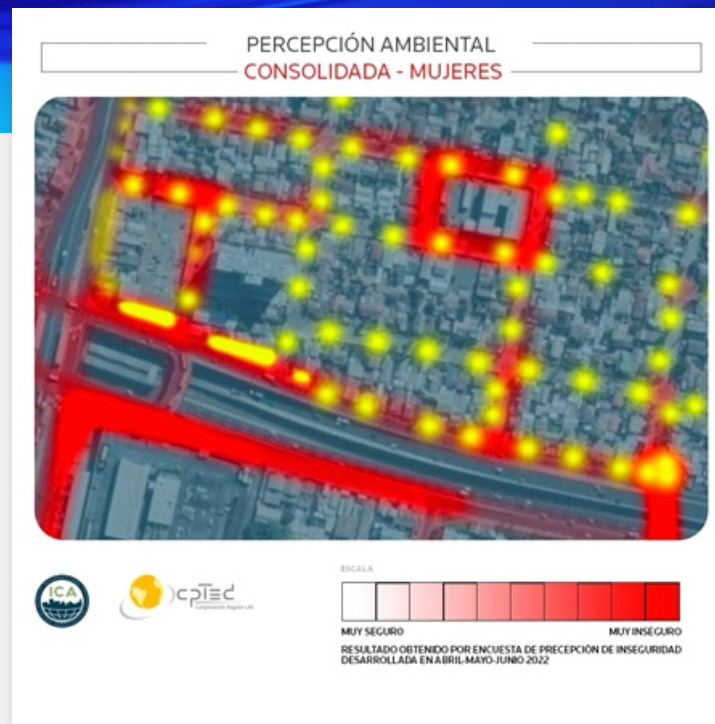
Foto 4. Ejemplo de mapa de localización espacial de áreas de percepción de inseguridad en Santiago, Estación Intermodal de Cisterna.

La comuna de Puente Alto se ha caracterizado por buscar una solución al problema delictivo siempre incorporando a la comunidad de forma activa con la idea de que: