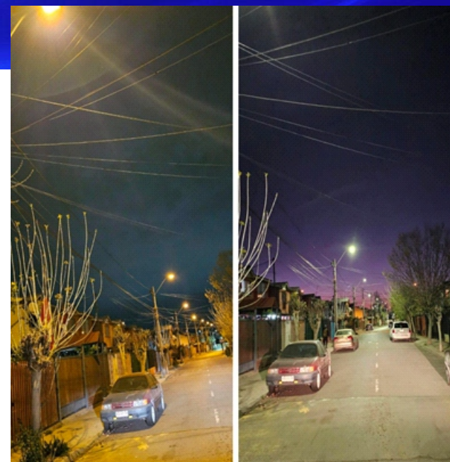
Foto 7. Recambio de luminaria de sodio (amarilla) a Led (blanca) año 2023 en calle Gálatas, Puente Alto.