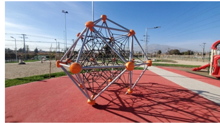
Foto 10. Las nuevas luminarias en bajos en Bajos de Mena, Puente Alto acompañan la recuperación de plazas y la percepción de seguridad de usuarios aumenta tanto de día como de noche.