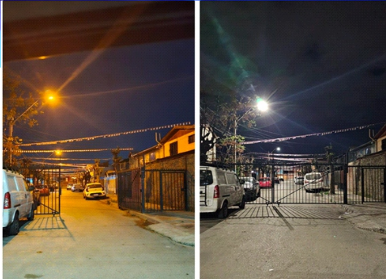
Foto 8. Recambio de luminaria de sodio (amarilla) a Led (blanca) año 2023 en pasaje Río Alvarado, Puente Alto.