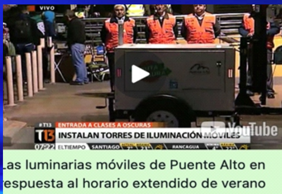
Foto 5. Luminaria móvil en Puente Alto