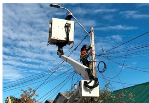
Recambio de luminarias LED en Puente Alto presenta un 44% de avance - Somos Puente Alto

Puente Alto es una comuna que se ha caracterizado los últimos 23 años por innovar optimizando sus recursos para lidiar con el complejo problema delictivo. Una de estas innovaciones que han sido destacadas a nivel internacional por la comunidad CPTED mundial es la de luminarias móviles impulsada por el alcalde Germán Codina ya que ajusta la solución a un problema sentido por la comunidad que es variable y permite la sostenibilidad del recurso ya que este se desplaza dependiendo de la hora y flujo peatonal. A través del equipo de alumbrado público municipal se ha logrado los últimos años y con liderazgo del alcalde transformar y actualizar el parque de alumbrado público en la comuna.