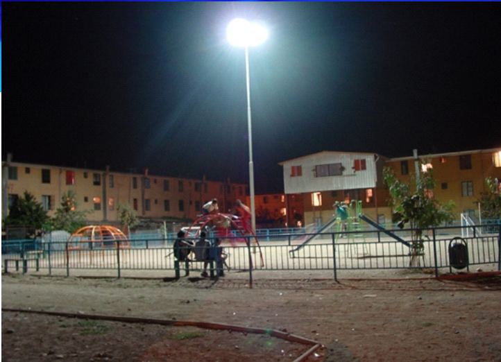
Foto 1. Villa El Caleuche (2006). Primera intervención CPTED para la reducción delictiva y de percepción de inseguridad.

La Seguridad Urbana es una disciplina de la criminología ambiental que busca entender e intervenir la relación que existe entre el entorno construido y la localización espacial de la delincuencia, violencia e incivildades en el territorio.