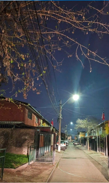
Foto 2. Pasaje Río Angostura con nueva luz de sodio.